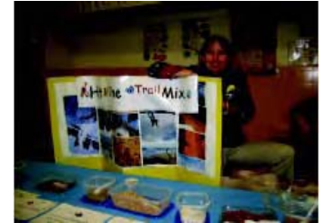
Profesora de tercer grado en un evento de salud para las familias.

Esta es la profesora de nutrición y educación física de la escuela Ulloa, líder en las caminatas, quien hace de esta actividad su prioridad.